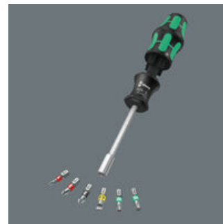
Het handgreep/wisselkling-systeem staat razendsnel wisselen van de kling toe en biedt zo talloze toepassingen.