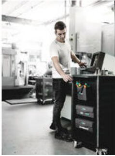
Wera 2go gereedschapsdraagtas 4